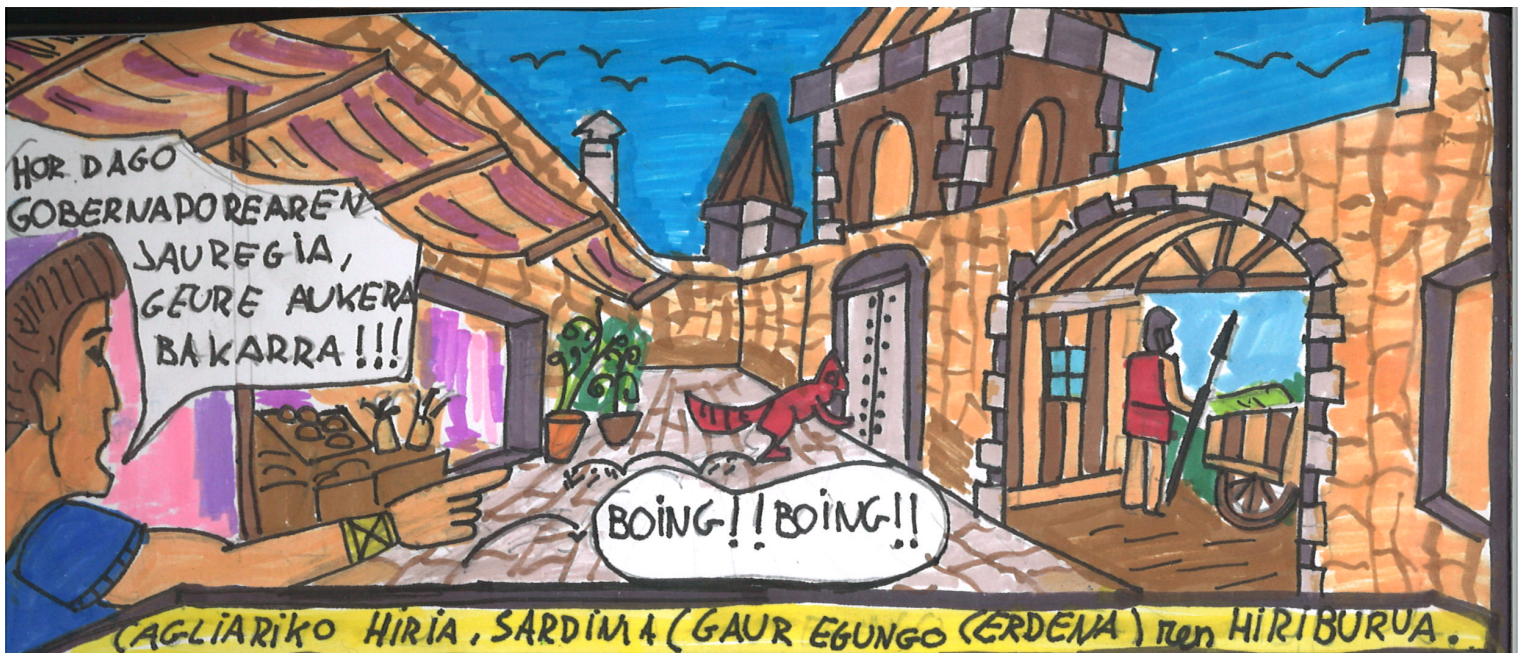
AGLIARIKO HIRIA, SARDINA (GAUR EGUNGO (ERDENA) ITEN HIRIBURUA.